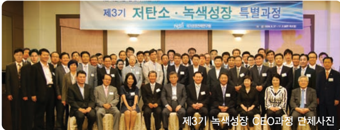
제3기 녹색성장 CEO과정 단체사진