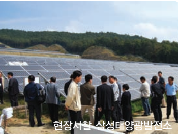
조옥희 삼성건설 친환경에너지연구소장