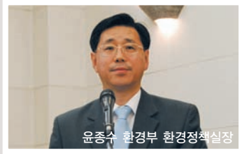
윤종수 환경부 환경정책실장