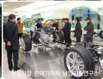
현장시찰 현대기아차 남양기술연구소