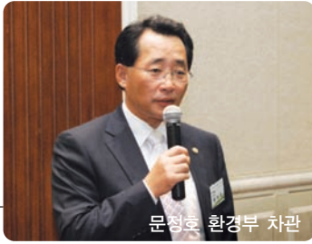
문정호 환경부 차관