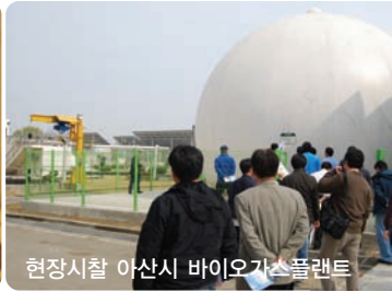
현장시찰 아산시 바이오가스플랜트