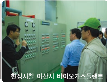
현장시찰 아산시 바이오가스플랜트