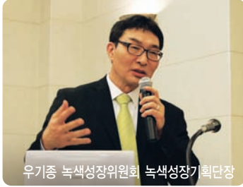
우기중 녹색성장위원회 녹색성장기획단장