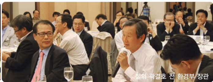
철의 광결호 전 환경부 장관