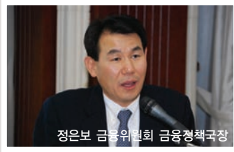
정은보 금융위원회 금융정책국장