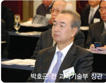
박호군 전 과학기술부 장관