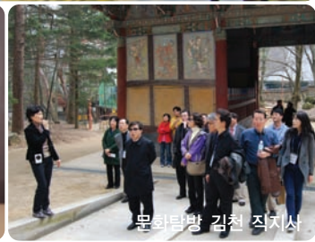
문화탐방 김천 직지사