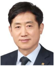
김주현 금융위원회 위원장