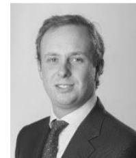
디미트리오스사라키스 EU 혁신정책 전문가