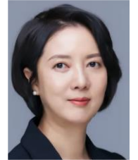
이영 중소벤처기업부 장관