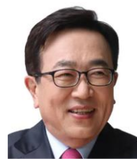
서병수 제 21대 국회의원 국민의힘