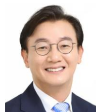
전재수 제 21대 국회의원 더불어민주당