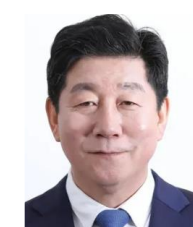
박재호 제 21대 국회의원 더불어민주당