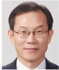
이종호 과학기술 정보통신부 장관