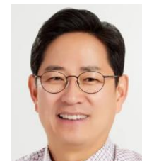
박수영 제 21대 국회의원 여의도연구원장