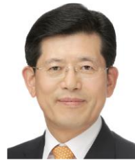
빈대인 BNK 금융지주 회장