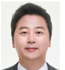
장예찬 국민의힘 청년 최고위원