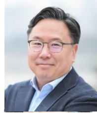
패트릭 윤 크립토닷컴 창업자