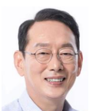
김도읍 제 21대 국회의원 국민의 힘