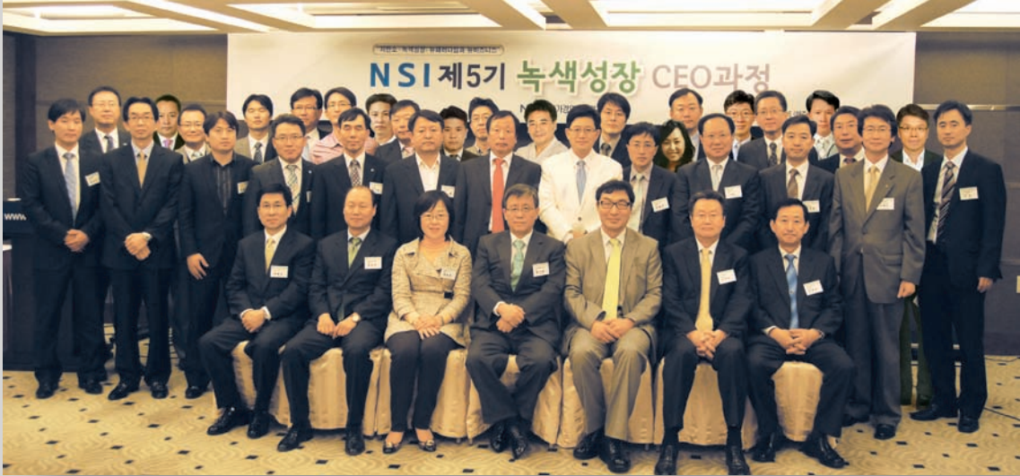
제5기 NSI 녹색성장 CEO과정 동문 사진