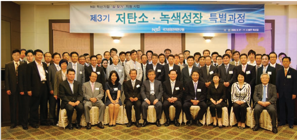
제3기 NSI 녹색성장 CEO과정 동문 사진