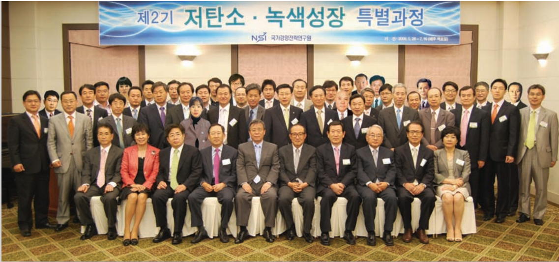
제2기 NSI 녹색성장 CEO과정 동문 사진