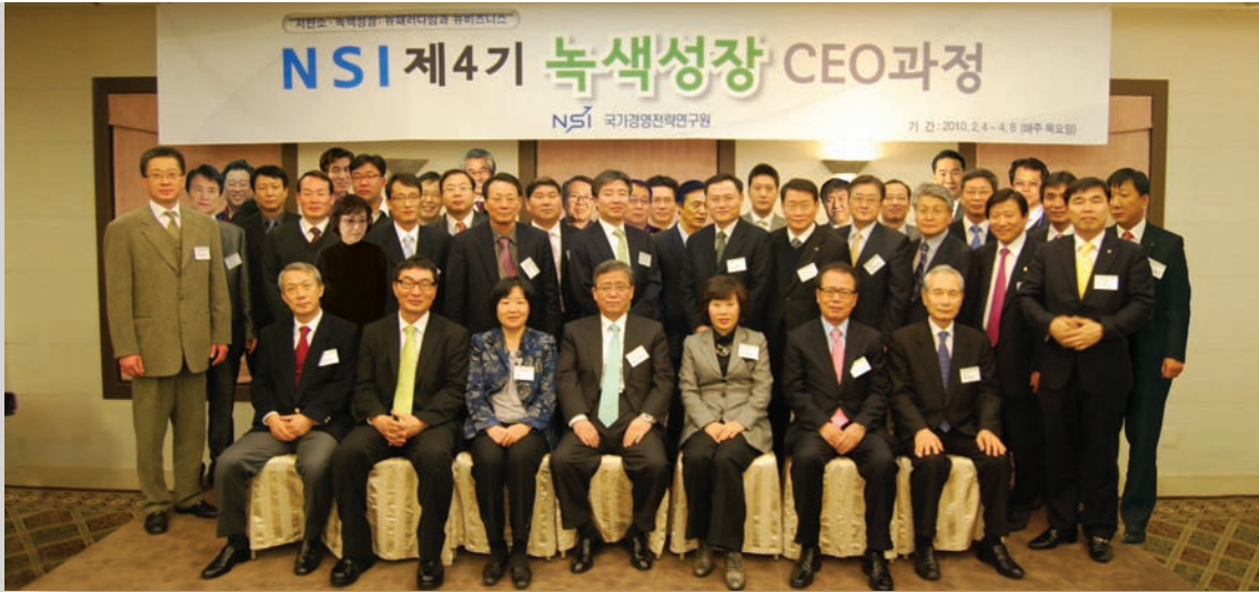
제4기 NSI 녹색성장 CEO과정 동문 사진