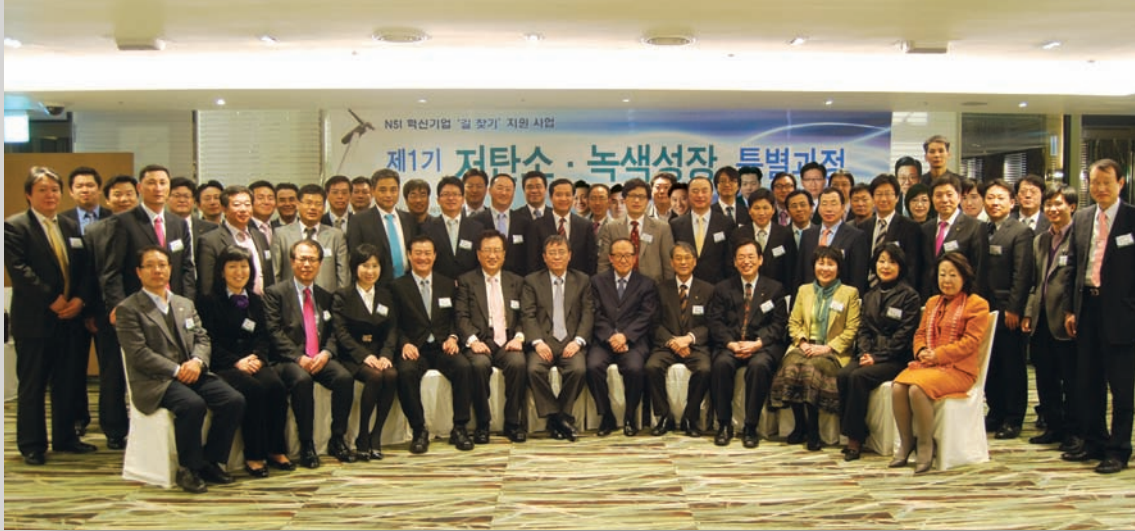
제1기 NSI 녹색성장 CEO과정 동문 사진