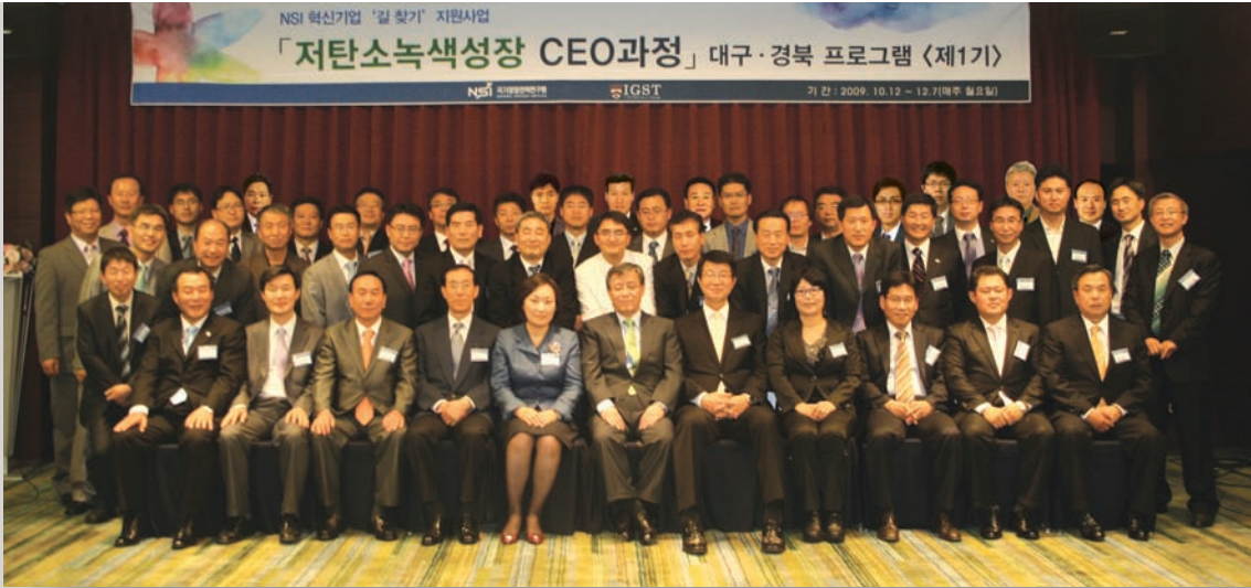
NSI 녹색성장 대구·경북 CEO과정 동문