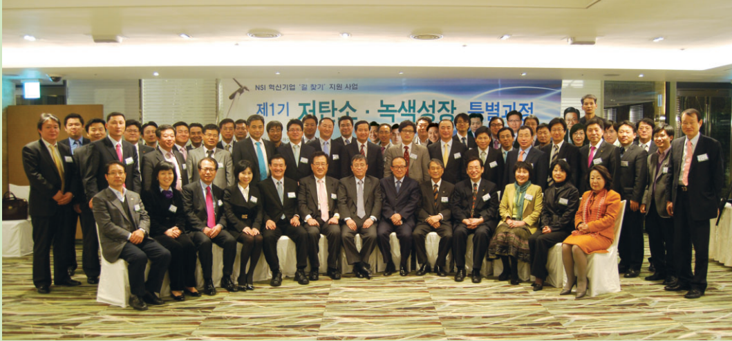
제1기 NSI 녹색성장 CEO과정 동문 사진