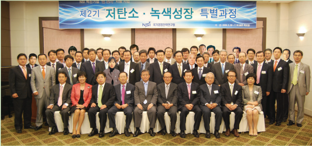
제2기 NSI 녹색성장 CEO과정 동문 사진