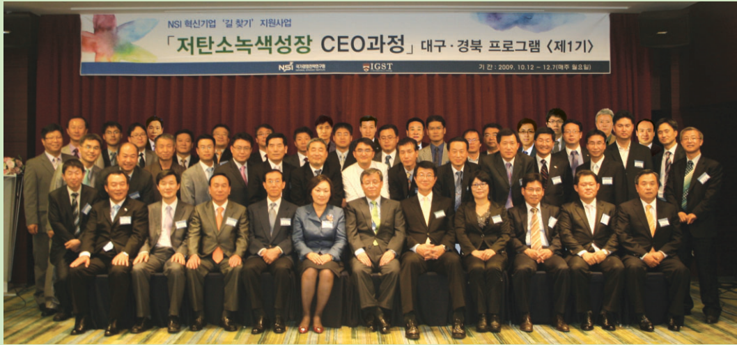
NSI 녹색성장 대구경북 CEO과정 동문