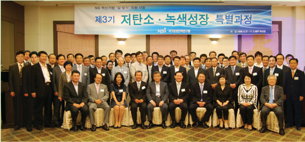
제3기 NSI 녹색성장 CEO과정 동문 사진